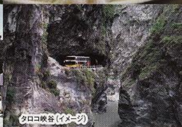
夕ロコ峡谷(イメージ)