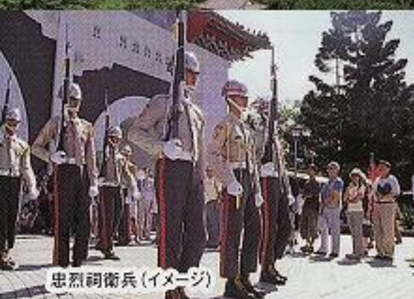
忠烈祠衛兵(イメージ)