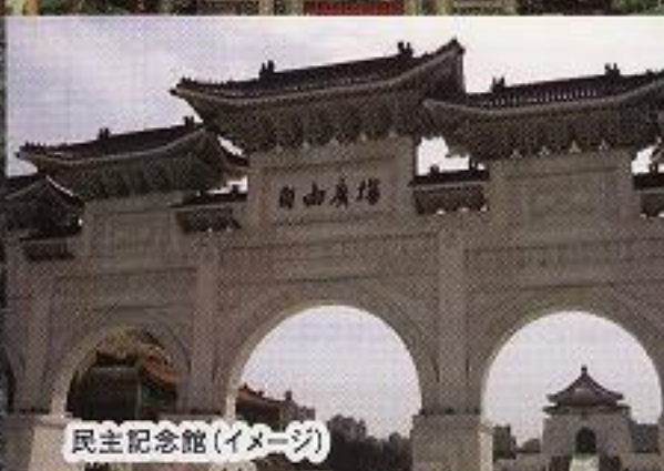
民主記念館(イメージ)